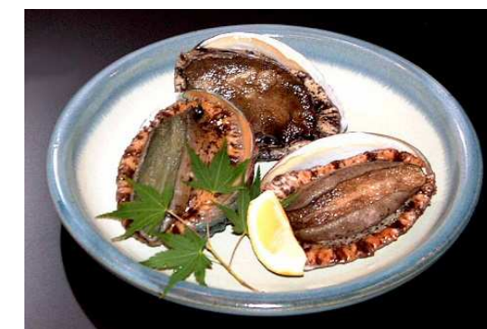
アワビのステーキ 時 価