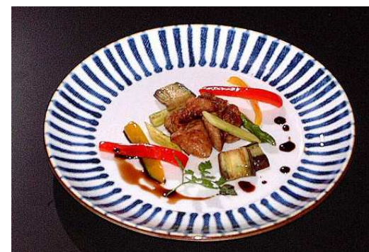
フォアグラと野菜のソテー ¥2,400