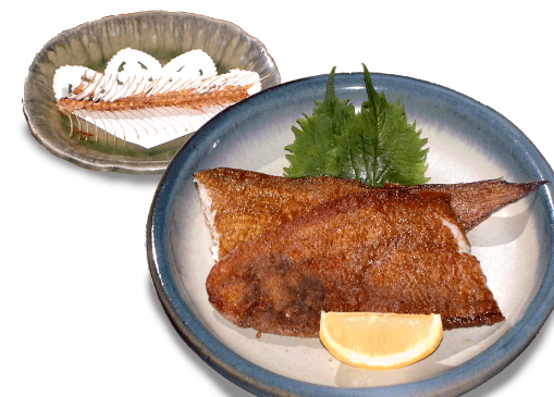
舌平目のムニエル ¥3,300