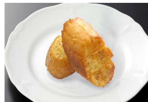
ガーリックトースト ¥660